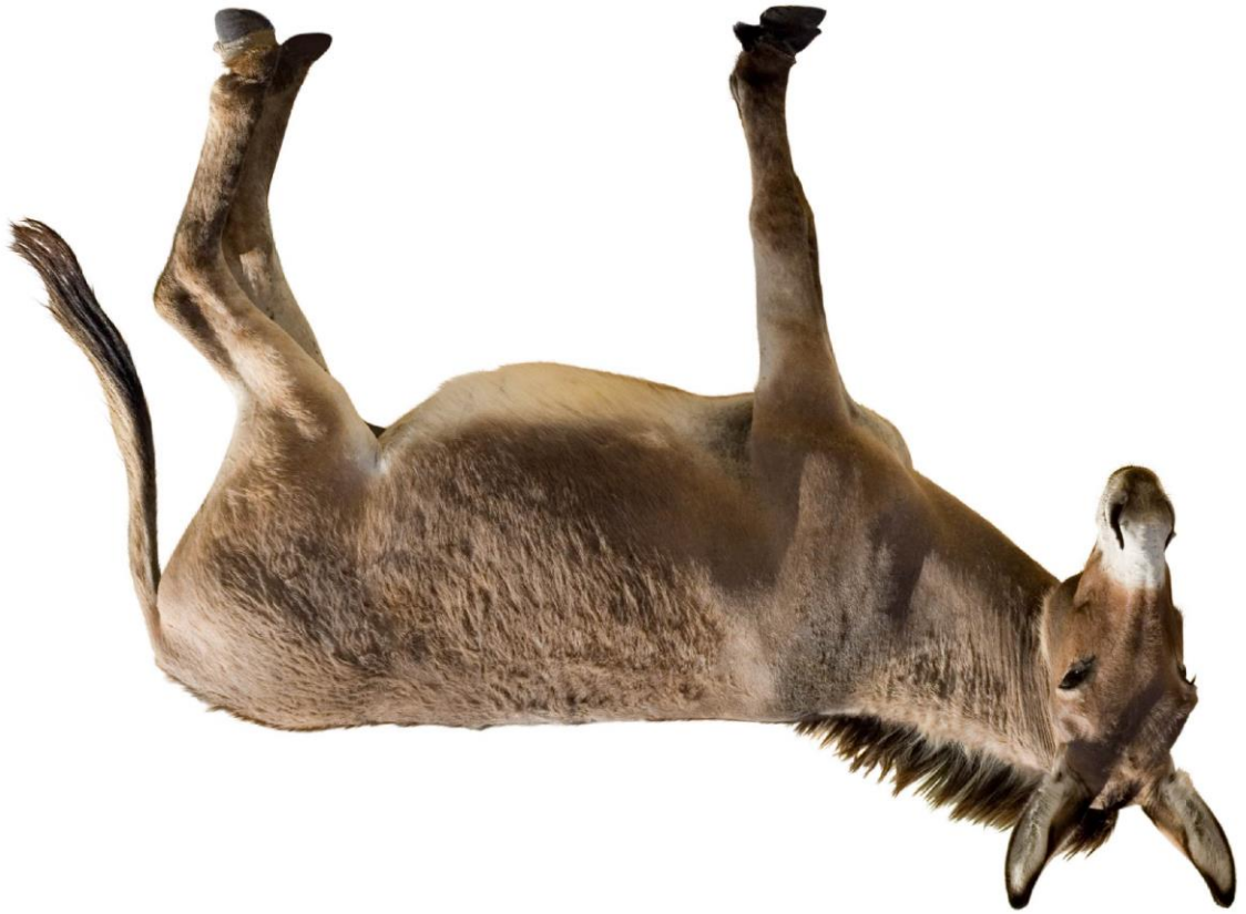
Abb.: © Coprid – fotolia