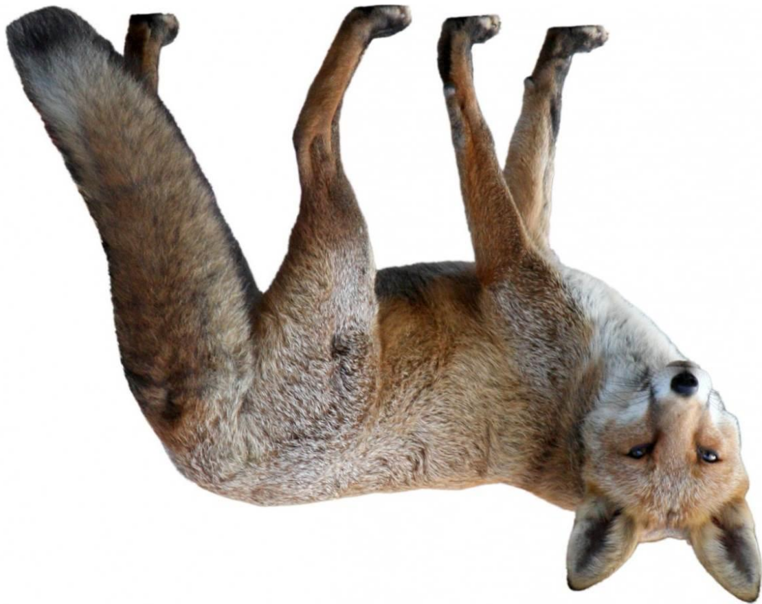
Abb.: public domain