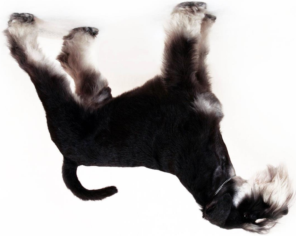
Abb.: © Zoriki