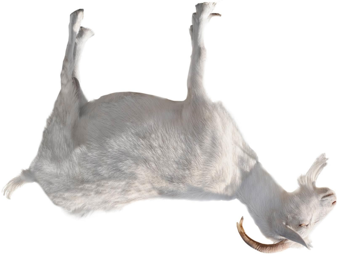
Abb.: © fotomaster - fotolia