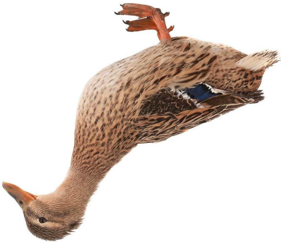
Abb.: © fotomaster - fotolia