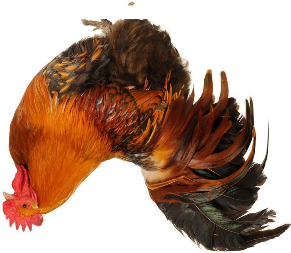
Abb.: © fotomaster - fotolia