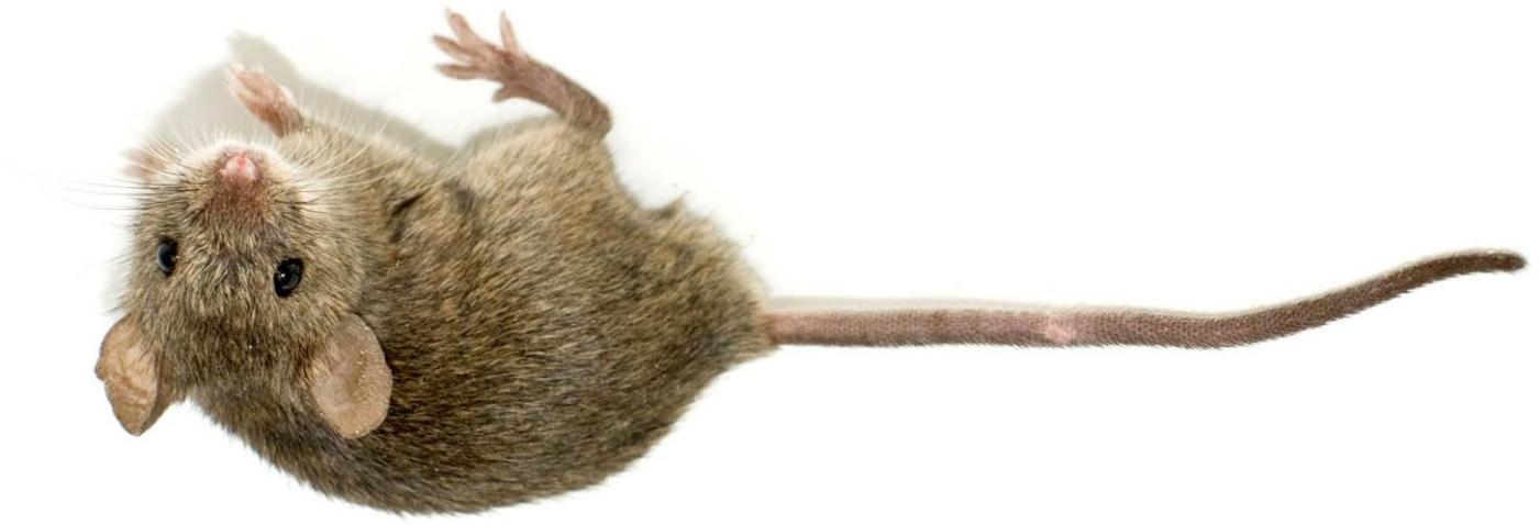
Abb.: © George Shuklin – fotolia