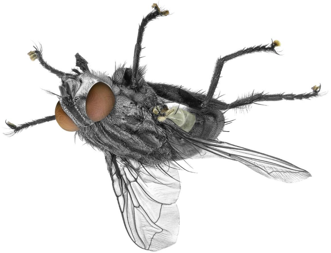
Abb.: © Alexey Protasov - fotolia