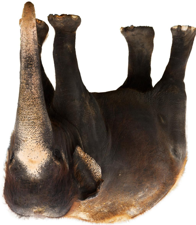
Abb.: public domain