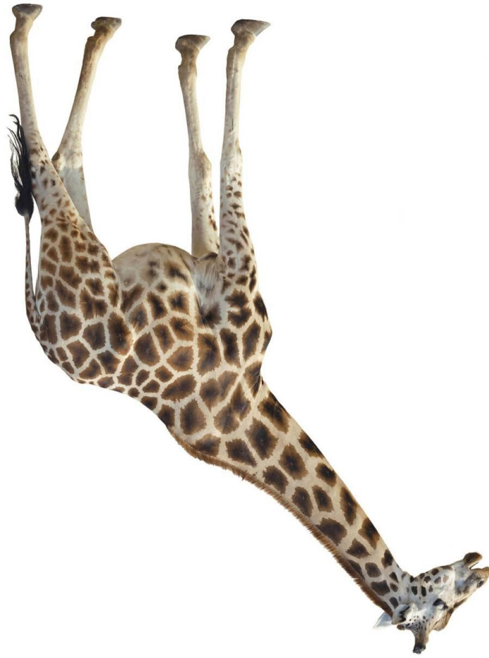
Abb.: © vesta48 - fotolia