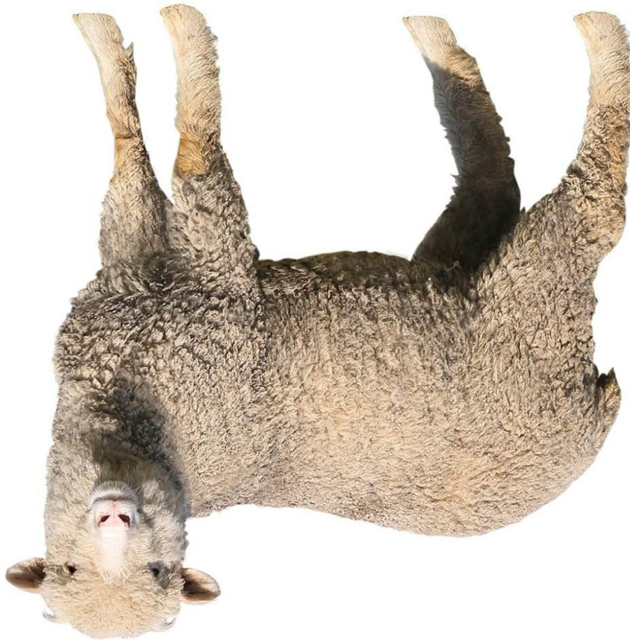
Abb.: © fotomaster – fotolia