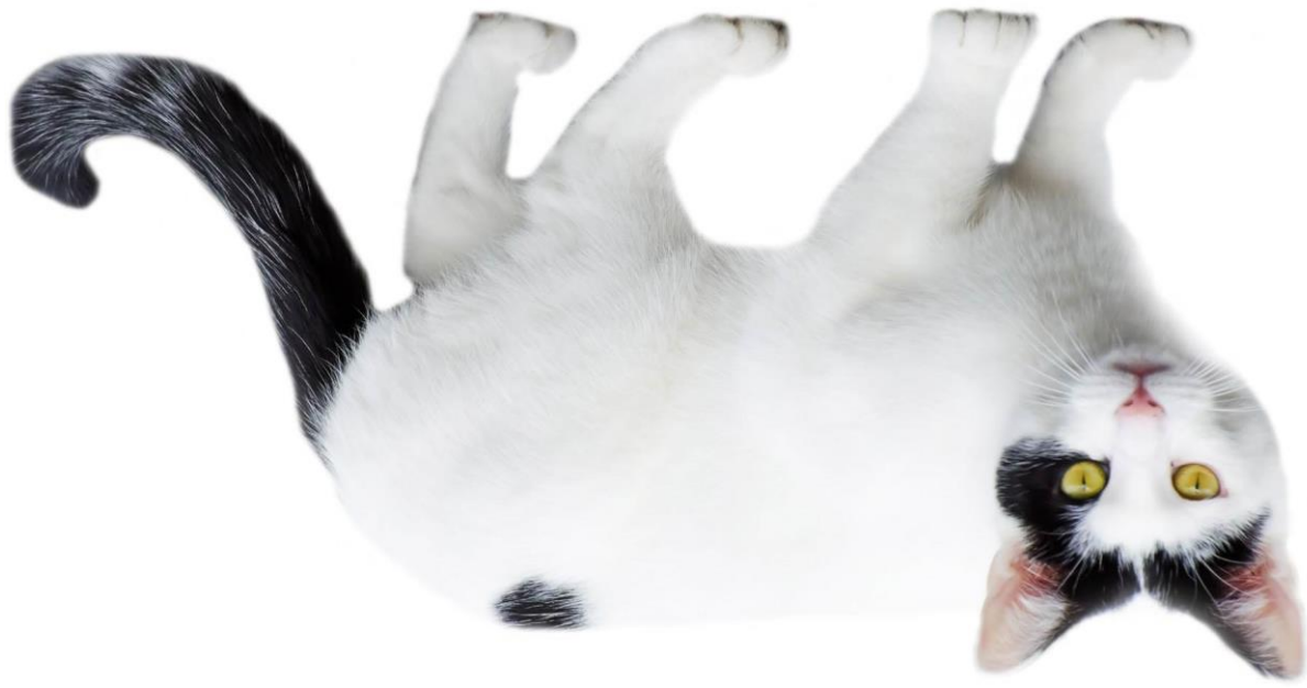
Abb.: public domain