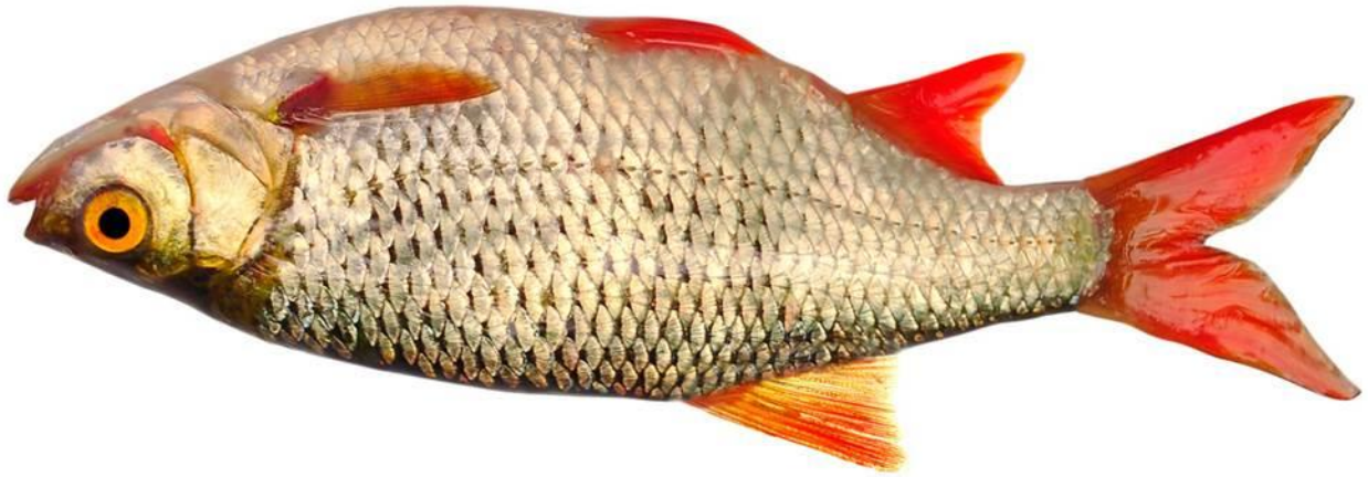
Abb.: © fotomaster - fotolia